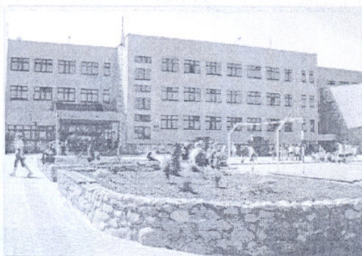
Fot. 2. Szkoła Podstawowa w Osieczynach