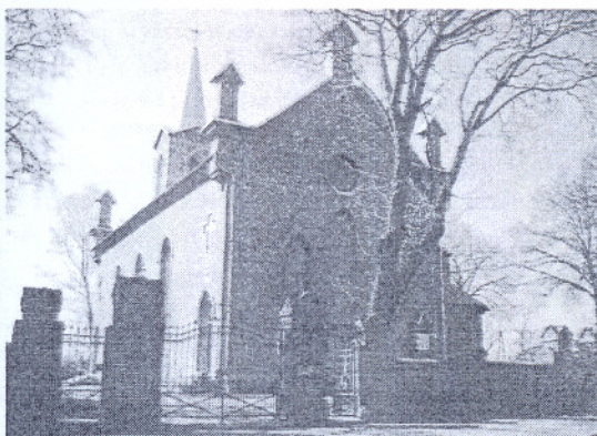
Fot. 4. Kościół w Osieczynach