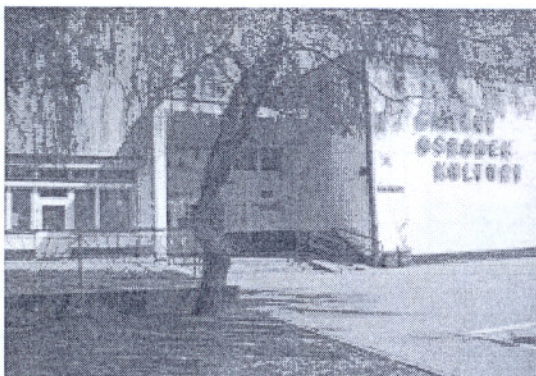
Fot. 1. Gminny Ośrodek Kultury